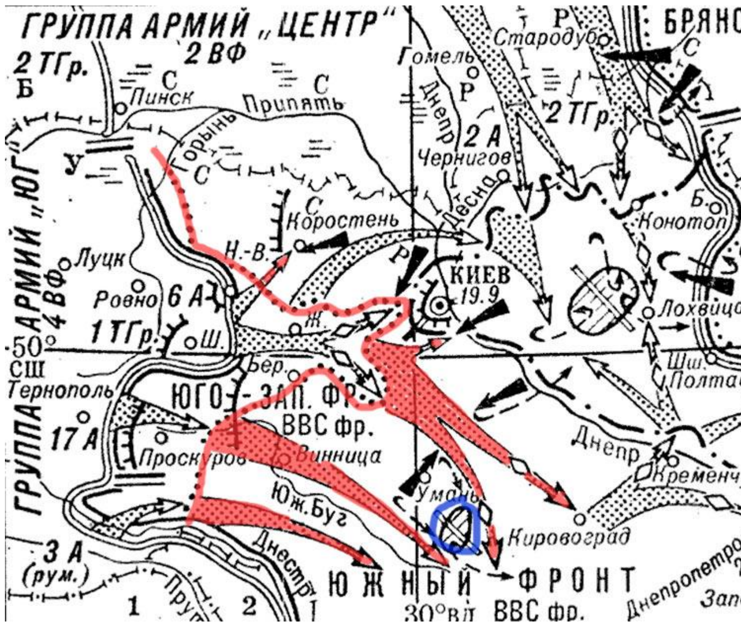
Показано положение фронта в районе Киева на 14 июля 1941 г. Синим цветом обозначены 6-я и 12-я советские армии, отступившие к Умани и попавшие в окружение. Удары на Киев остановлены, севернее города РККА прочно удерживает позиции.